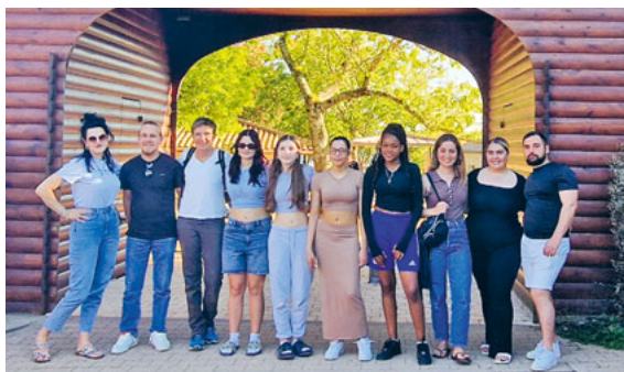
Schülerinnen der dritten Oberstufe Littau mit neuen Bekanntschaften, welche Sie in Taizé geknüpft haben. Unten schildern sie ihre Eindrücke der Reise.

Ein Aufenthalt in Taizé kann helfen, Abstand zu gewinnen vom Alltag, ganz verschiedene Menschen kennenzulernen und über ein Engagement in Kirche und Gesellschaft nachzudenken.