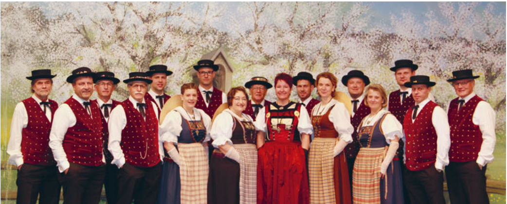
Der Jodlerklub Littau (Bild oben) und der Jodlerklub Heimelig Horw (Bild unten) freuen sich über Ihren Besuch.