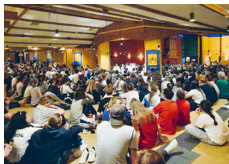
Gottesdienst in der Versöhnungskirche von Taizé.