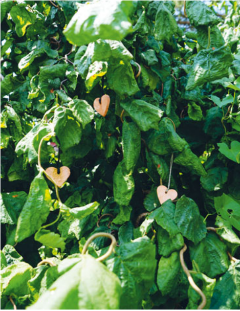
Hängen auch Sie ein Herz an den Herzlibaum. Finden Sie ihn?

Rund um unsere Pfarrkirche gibt es immer noch den Gedankenweg. Bestimmt ist Ihnen der „Herzlibaum“ schon aufgefallen.