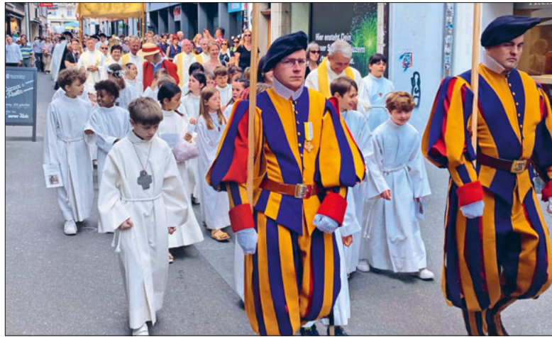
Fronleichnamsprozession 2023: Die Erstkommunionkinder feiern und bezeugen ihren Glauben an Jesus.

Bei einem der Vorbereitungsanlässe zur Erstkommunion kam die Frage auf: Wie konnten die Jünger echte Freunde Jesu sein und ihm dann doch untreu werden?