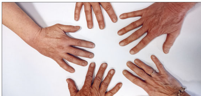
Viele Hände, die bewegen.

«Reisende kann man nicht aufhalten», sagt ein Sprichwort. Der Ruf zur Veränderung kann von aussen oder von innen kommen. Es ist ein Glück, wenn man dem inneren Kompass folgen darf.