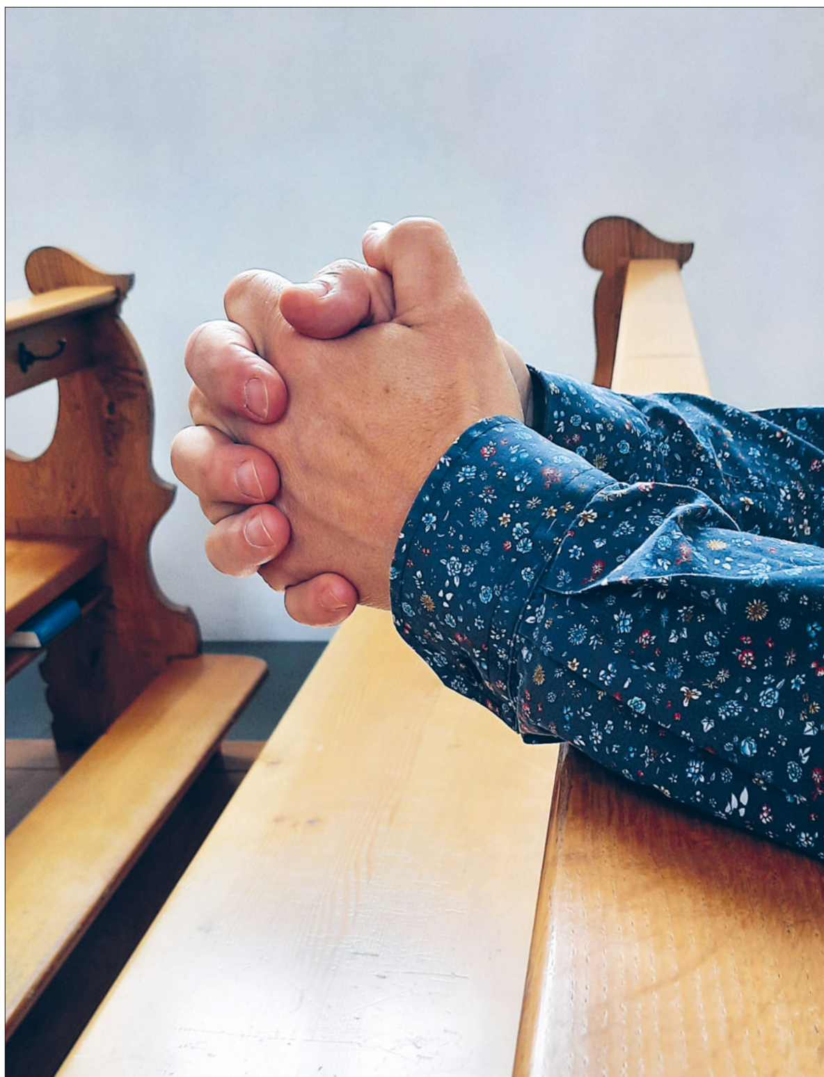
Glaube ist nur möglich, wenn er aus freien Stücken vollzogen wird.

Die Veranstaltungsreihe «Willkommen in meiner Bubble» wird fortgesetzt. An neuen Orten begegnen sich Menschen und diskutieren zu neuen Themen. Seite 15