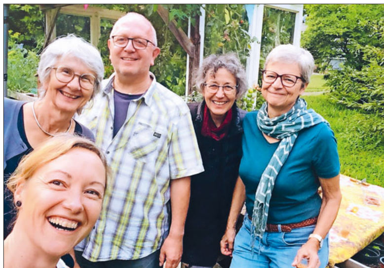
Das fröhliche Freiwilligenteam des Gemeinschaftsgartens Eichhof.

Am 31. Mai ist internationaler Tag der Nachbarschaft. Verschiedene Akteur:innen machen mit Angeboten im Quartier auf diesen Tag aufmerksam.