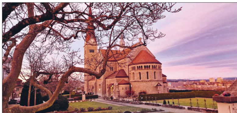
Sonnenaufgang über der Kirche Philipp Neri.

Unser Kirchenpatron, der heilige Philipp Neri, hinterliess nicht nur spirituelle Weisheiten, sondern auch eine tiefgreifende Lehre über den Heiligen Geist und die Bedeutung von Pfingsten.