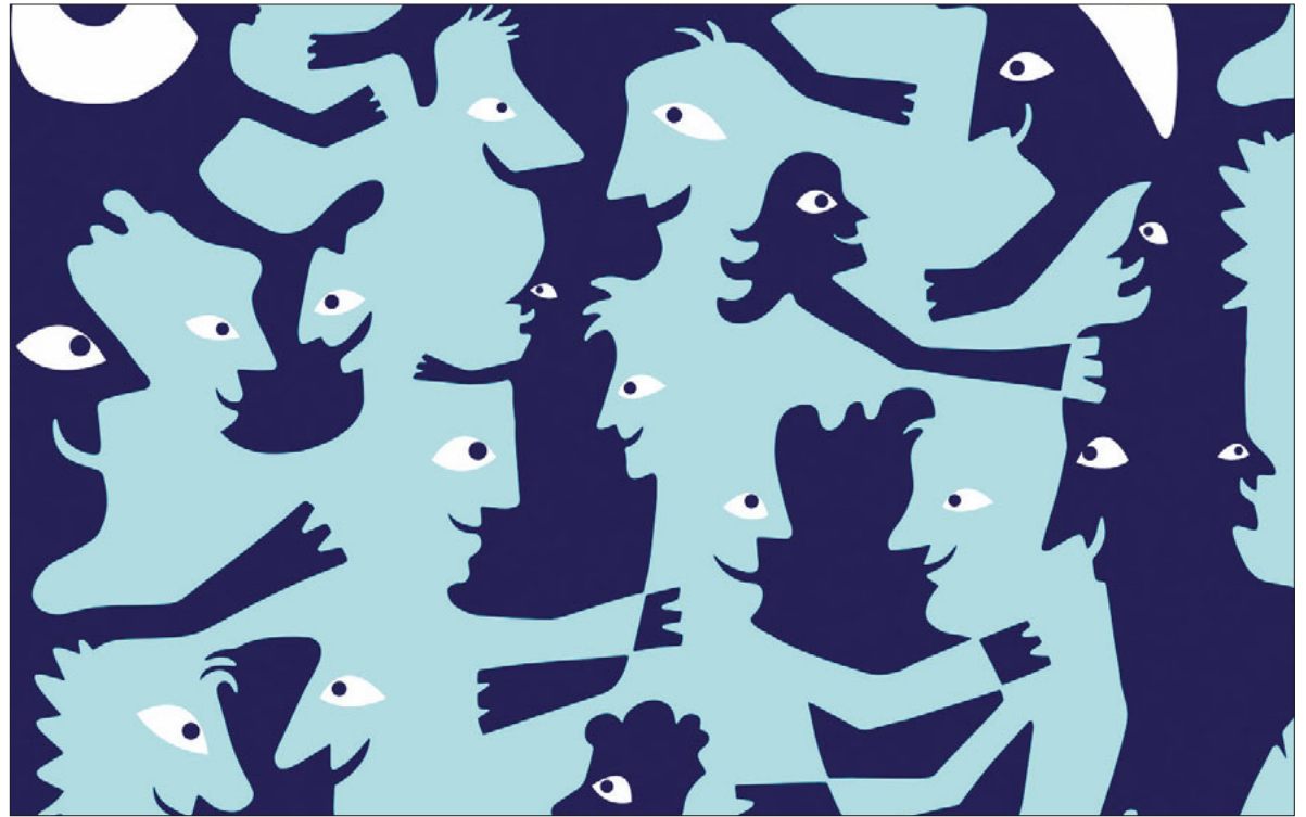
Ausschnitt aus dem Plakat der diesjährigen Solidaritätswoche. Gestaltung: Thomas Jaquet