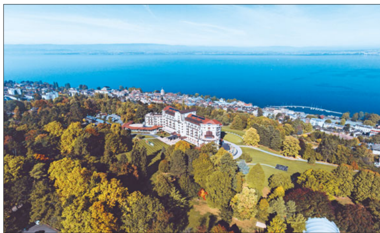
Wunderbare Aussicht auf Evian.

Unsere Pfarreiseiten bieten immer tolle Erlebnisse und Augenblicke. Gibt es etwas Schöneres, als einen mehrtägigen Ausflug mit lieben Menschen zu verbringen?