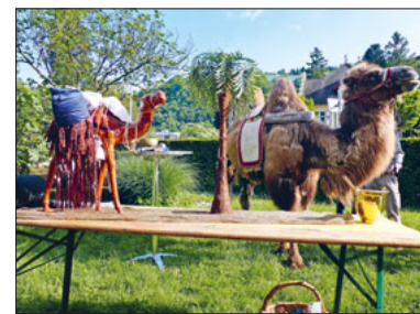
Tierische Gäste.

Das diesjährige Kinderkapellenfest wird sehr vielstimmig sein. Im farbenprächtigen Garten wird gegessen, gespielt, geplaudert und gebastelt. In der Kinderkapelle, welche zur Klangkapelle umgestaltet wird, werden wir durch die vielfältigen Klänge der Klangschalen verzaubert. Für unsere tierischen Freunde werden wir etwas Schönes basteln, das anschliessend nach Hause mitgenommen werden kann. Auch dieses Jahr gibt es einen besonderen Überraschungsgast. Alle sind herzlich eingeladen. Eine Anmeldung ist nicht erforderlich.