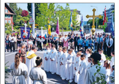
Prozession 2023.

Wir laden Sie alle zum Fest von Fronleichnam am Donnerstag, 30. Mai mit einer Prozession, beginnend bei der Kirche zum Zentrum St. Michael (ZSM), ein. Wir starten um 9.45 Uhr auf dem Kirchenplatz. Nach einem kurzen Zwischenhalt mit Gebet und Musik beginnt der Gottesdienst auf dem Vorplatz des ZSM um 10.30 Uhr. Zusammen mit der Musikgesellschaft Littau und den Erstkommunikanten feiern wir Jesus Christus an diesem Tag speziell in der Gestalt des Brotes. Danach offeriert der Kirchenrat einen Apéro, der von den Kindern verteilt wird. Wir freuen uns, Ihnen auch in feines Mittagessen zu familienfreundlichen Preisen anbieten zu dürfen. Blauring und Jungwacht betreuen die Kinder bei Spiel und Spass! Ihnen ein herzliches Dankeschön. Seien Sie herzlich willkommen. Wir freuen uns auf Sie! Bei unsicherer Witterung erhalten Sie ab 9 Uhr unter 078 320 75 72 Auskunft über die Durchführung der Prozession.