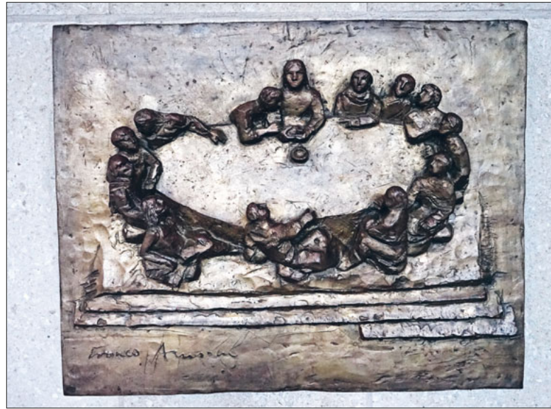
Bronzetafel in der Pfarrkirche St. Theodul: Gastmahl Jesu von Franco Annoni.

Es gibt Schwächen, die gehören zur «Grundausrüstung» der Kirche. Waren die Apostel eine solche Schwäche? Durch die Gabe des Heiligen Geistes wurden sie zu Überbringern der Frohen Botschaft.