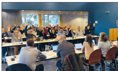
Der Grosse Kirchenrat an seiner letztjährigen Sitzung.

Der Grosse Kirchenrat, das Parlament der Katholischen Kirchgemeinde Luzern, tagt am Mittwoch, 22. Mai, ab 13.30 Uhr bis 17.30 Uhr im Kirchensaal Der MaiHof, Weggismattstrasse 9.