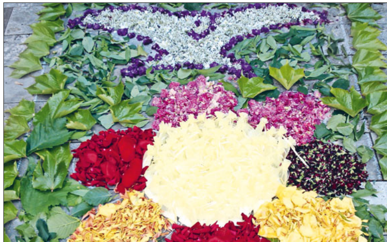
Mit Blüten und Blättern gelegt: der Heilige Geist in Form einer Taube.