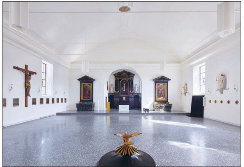
Die leere Kapelle als Möglichkeitsraum.

Der christliche Glaube ist ein österlicher Glaube. Und so verwundert es nicht, dass das Christentum seit dem Tiefpunkt des Karsamstags im Laufe der Geschichte aus Phasen des Niedergangs letztlich immer wieder mit neuer Kraft hervorgegangen ist. Nutzen wir mit einer gesunden Portion Gottvertrauen die Chancen, die sich uns in der gegenwärtigen Epoche des Umbruchs bieten. Nutzen wir die Begabungen, die uns gegeben sind, um die Welt um uns lebens-