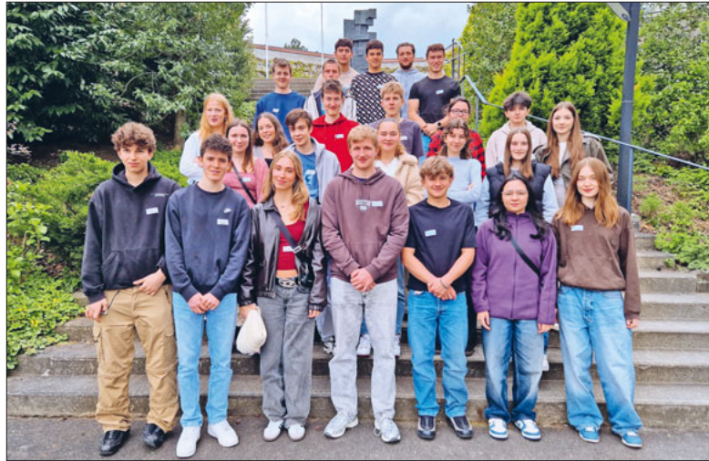
Die Firmgruppe am Begegnungstag in St. Michael: startklar für die Firmung.

25 junge Menschen werden am 25. Mai gefirmt. Es ist der Abschluss eines Weges, der im letzten Herbst begonnen hat.