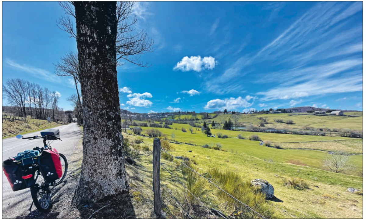
Wo Himmel und Erde sich berühren.