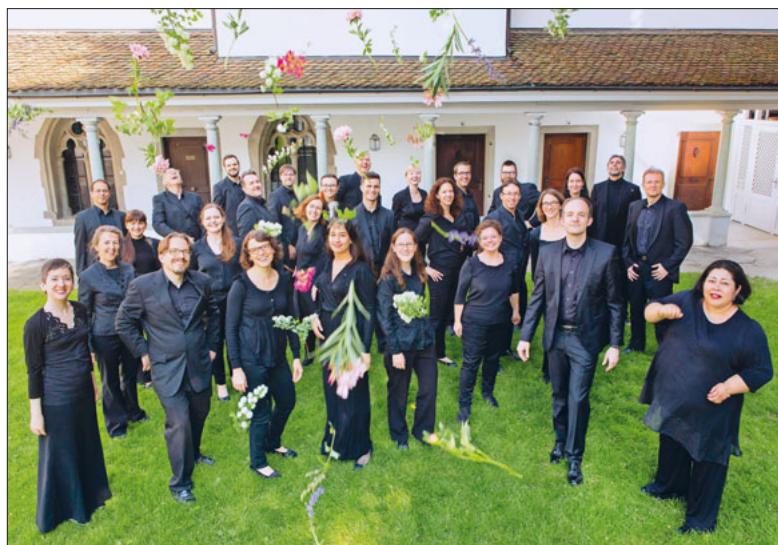
Das Collegium Vocale zu Franziskanern.

Im Frühlingsmonat Mai wird zu mehreren Gelegenheiten Musik zu hören sein, die ermuntert, tröstet und aufbaut.