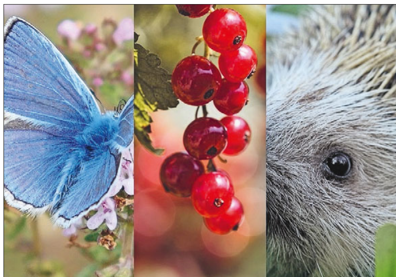
Unkonventionelle Gärten und vielfältige Gartenphilosophien.

Ein Sonntagsspaziergang gibt Einblick in drei Privatgärten im Wesemlinquartier und in verschiedene Gartenphilosophien.