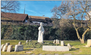
Bruder Klaus und Friedensstein in Solothurn.