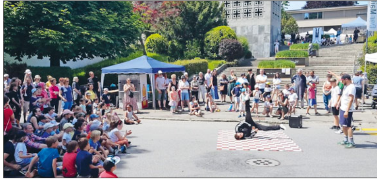
Dieses Jahr punktet der Maihof – vor zwei Jahren war das MaiFest-Motto «Der Maihof steht Kopf».

So lautet das diesjährige Motto. Das Maihof-Quartier sticht in vielerlei Hinsicht positiv hervor. Neuerdings punktet es mit einer Begegnungszone auf der Weggismattstrasse.