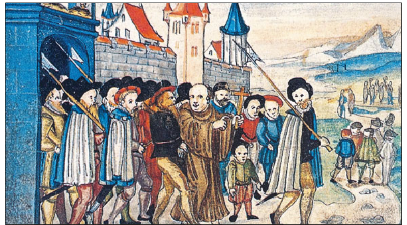
Der wegen Zerstörung eines Wegkreuzes verurteilte Klaus Hottinger wird 1524 zur Richtstätte auf der Sentimatte geführt.

Am darauffolgenden Tag, Sonntag, 5. Mai findet der alljährliche Musegger Umgang statt. Die Pfarreien St. Karl, Der Maihof-St. Josef und St. Leodegar im Hof sowie die Quartiervereine Luegisland und Hochwacht laden dazu ein. Beginn ist um