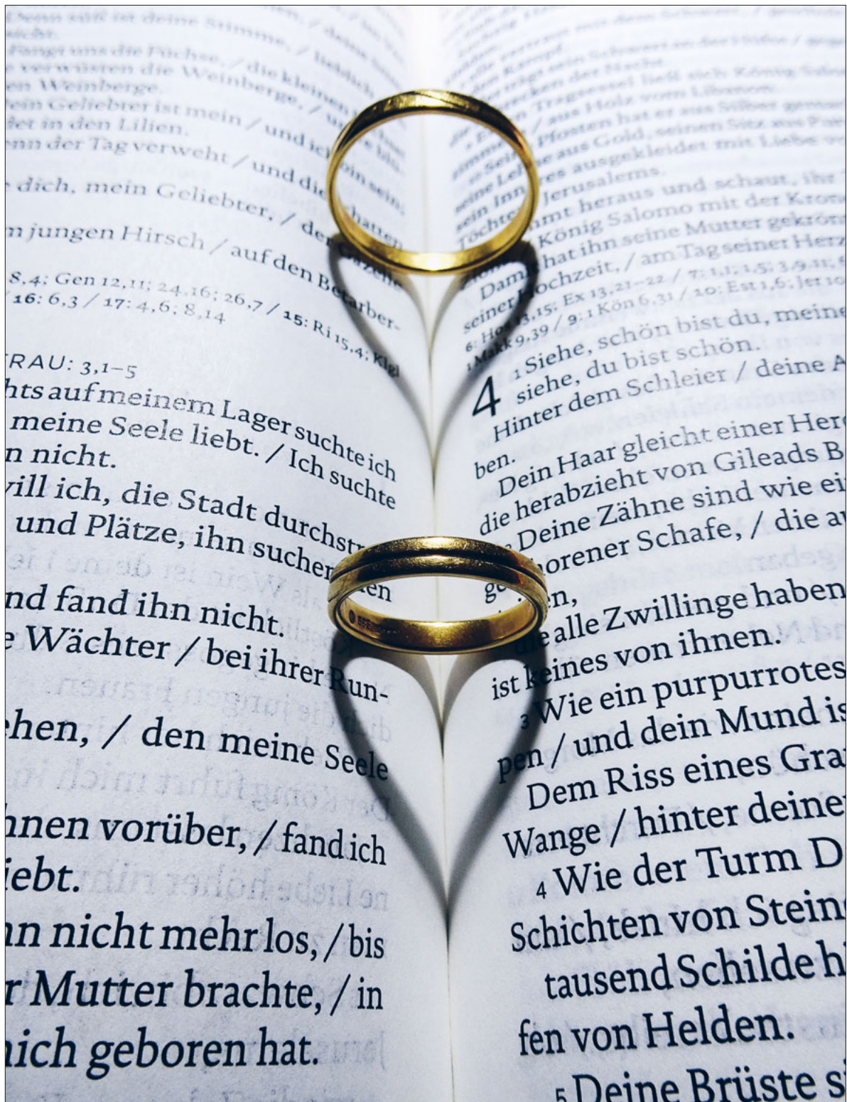
Immer weniger Paare versprechen sich vor Gott die Treue.

Seit mehr als 500 Jahren findet der Musegger Umgang, damals eine Prozession, statt. Der Anlass war gleichbedeutend wie eine Wallfahrt nach Rom und mehrere Tausend Personen nahmen daran teil. Der Umgang findet am 5. Mai statt. Seite 15 und Pfarreiseiten