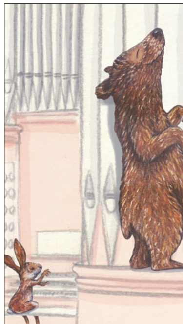
Der Bär lauscht der feinen Melodie, die der Hase spielt. Bild: Kathrin Schärer

Treffpunkt: SA, 11. Mai, 10.30 Uhr, beim Haupteingang vor der Jesuitenkirche Luzern; Eintritt frei, Kollekte Keine Anmeldung erforderlich