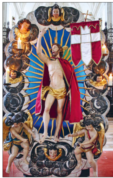
Darstellung des auferstandenen Christus (Pfarrei St. Leodegar im Hof).