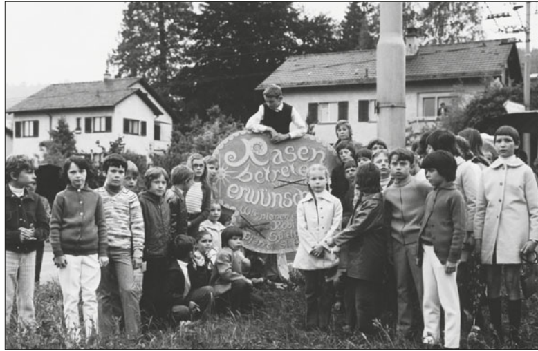
Die Übergabe der Pfarreiwiese, auf welcher der heutige Spielplatz steht.

Die Pfarrei St. Anton feiert ihren 70. Geburtstag. Gerne reiht sich auch der Quartierverein Tribtschen-Langensand unter die Gratulierenden ein.