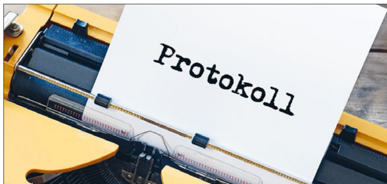
Das Protokoll wurde noch auf einer Schreibmaschine geschrieben.

Das Leben ist ernst genug, da tut Humor gut. Wir hatten schon Aktuare im Kirchenrat, die hatten nicht nur Humor, sondern den Schalk im Nacken. Früher hiessen sie noch Ratsschreiber.