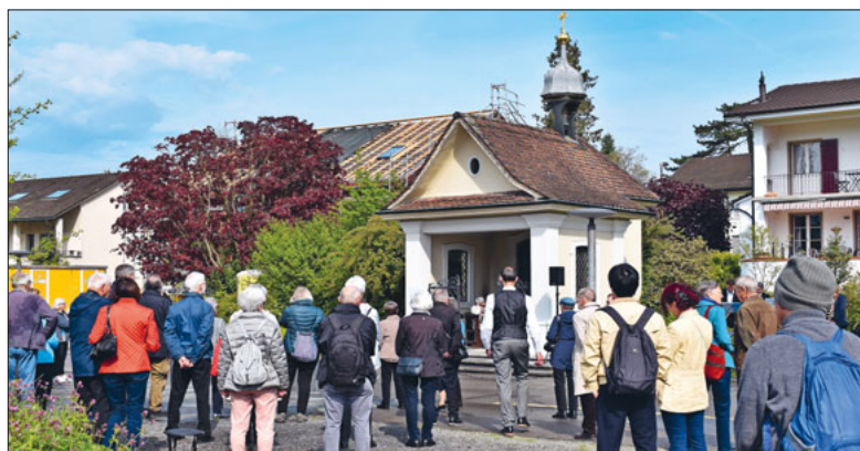
Kommunionfeier bei der Museggkapelle.

Der Musegger Umgang lädt uns ein, über das Zusammenleben in den Quartieren, der Stadt und weltweit nachzudenken und zu feiern.