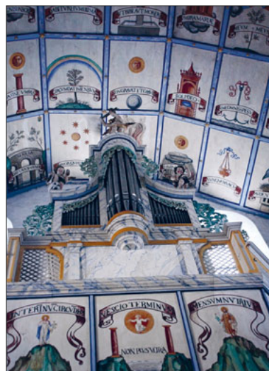
Der Bilderhimmel über der Orgel in der Kirche Hergiswald.