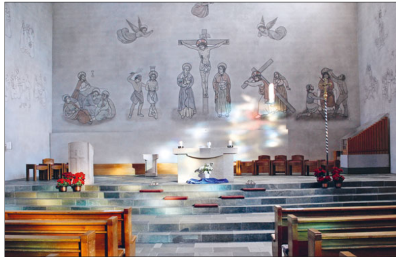
Darstellung der Auferstehung Jesus in der Pfarrkirche St. Theodul in Littau.

Himmelfahrt Christi bedeutet, dass Jesus zum Vater heimgegangen ist, dass er von ihm aufgenommen worden ist und uns den Heiligen Geist gesandt hat.